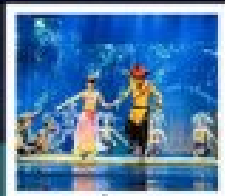
โชว์เซ็นจูรี่