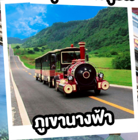
ภูเขาฉางฟ้า