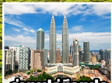
ถ่ายรูปคู่ตึกแฝด