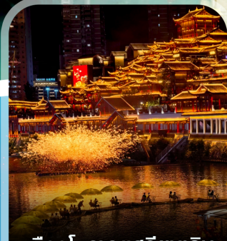
เมืองโบราณเสวียนเอน