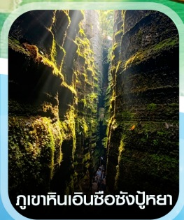
ภูเขาหินเอนชือซังปู้หยา