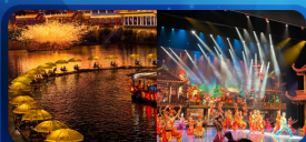
ล่องแพมังกร ชมไฟสวยงามยามค่ำคืน ชมการแสดงวัฒนธรรมจีน ชมการแสดงวงมโหรีจีน