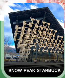
SNOW PEAK STARBUCK

คอนเฟิร์ม ออกเดินทาง ทุกพีเรียด 2 ท่านขึ้นไป