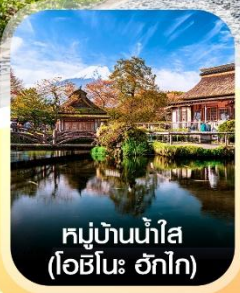
หมู่บ้านน้ำใส (โอชิโนะ ฮักไก)

✈️ คอนเฟิร์ม ออกเดินทาง ทุกพีเรียด 2 ท่านขึ้นไป