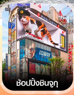
ซ้อปิ้งชินจูกุ