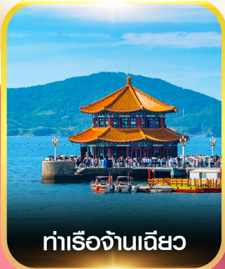
ท่าเรือจันทิว