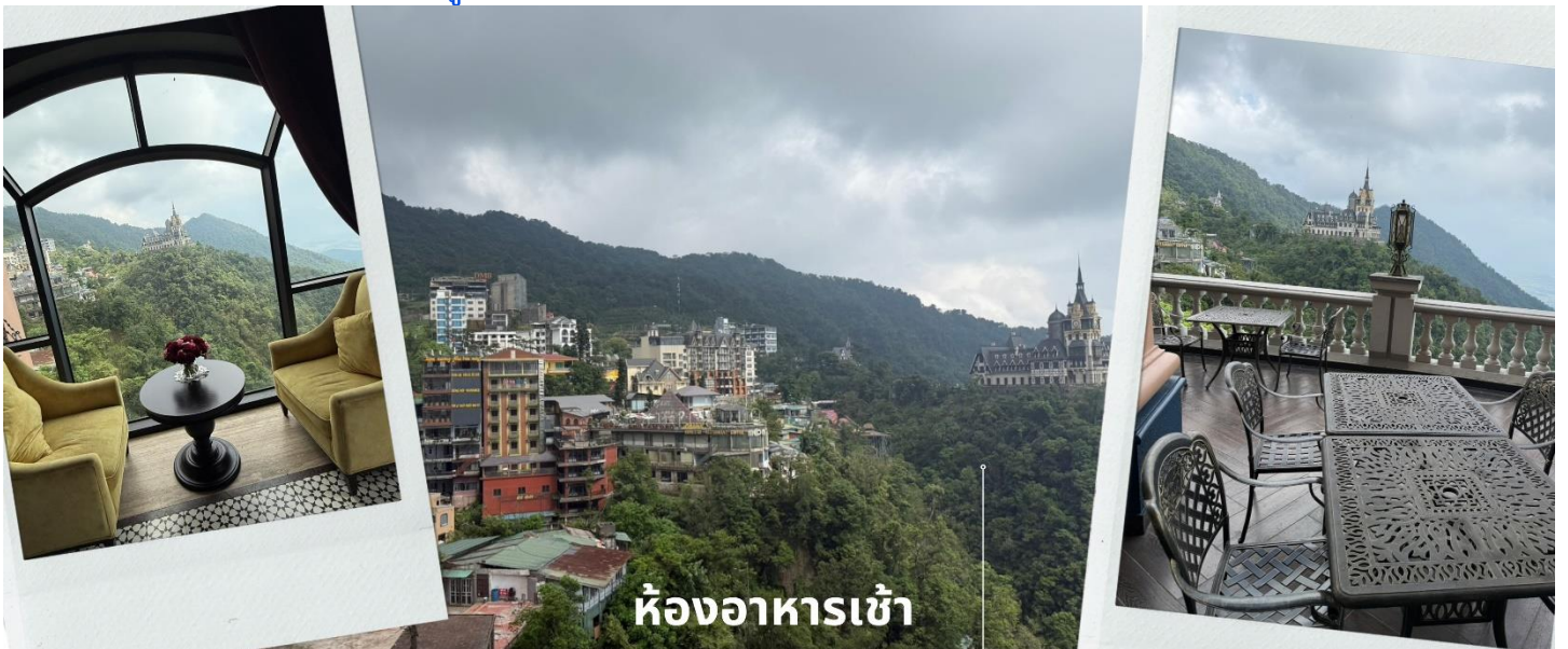
ห้องอาหารเช้า

จากนั้นนำท่านไป คาเฟ่ (Quan Gio Tam Dao) อยู่ที่เมืองตามด้าว ตั้งอยู่บนเนินเขาสูงราว 1,000 เมตรเหนือระดับน้ำทะเล ทำให้ได้สัมผัสสายลมเย็นๆ ได้ทั้งวันเลย คาเฟ่ที่ตั้งอยู่ใกล้กับโบสถ์หิน และจัตุรัสกลางเมืองตามด้าว ซึ่งเป็นแหล่งท่องเที่ยวหลักของเมืองนี้ ที่นี่มีปราสาทตามด้าว เป็นไฮไลท์ของที่นี่เลย ปราสาทสีขาวสุดอลังการที่ตั้งอยู่ท่ามกลางเขา เหมือนกับหลุดออกมาจากเทพนิยายยุโรป ร่วมกับบรรยากาศหมอกบาง ๆ ทำให้มุมนี้กลายเป็นหนึ่งในวิวที่โรแมนติกที่สุดในเมืองของตามด้าว