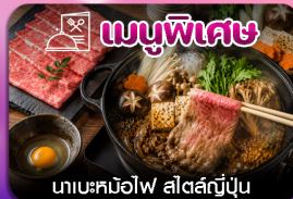
เมนูพิเศษ นาเบะคินอิโง สัตสึมันจู