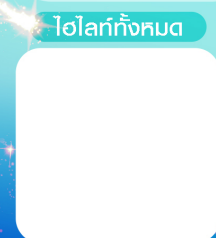
โฮเทลทั้งหมด