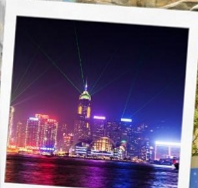
โชว์ SYMPHONY OF LIGHT