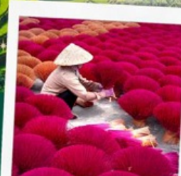
หมู่บ้านรูป