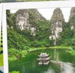
ล่องเรือจางอาน