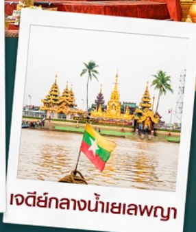
เจดีย์กลางน้ำเยเลพญา