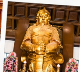
วัดเขากงหมิว