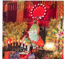
เจ้าแม่กวนอิมสองฮา