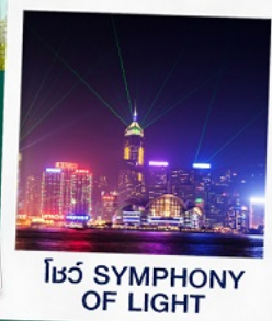
โชว์ SYMPHONY OF LIGHT