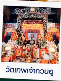
วัดเทพเจ้ากวนอู