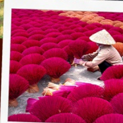
หมู่บ้านรูป