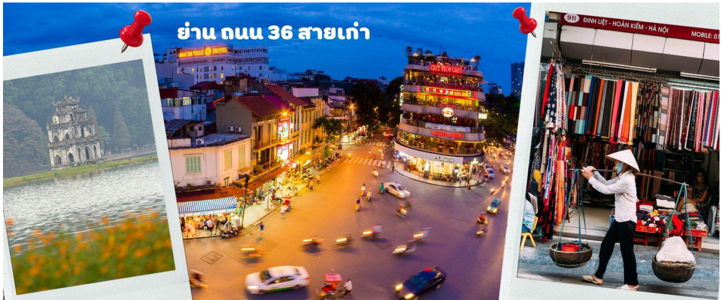
ย่าน ถนน 36 สายเก่า

จากนั้นให้ท่านได้ อิสระช้อปปิ้ง ถนนสาย 36 street แหล่งช้อปปิ้งของฮานอย มีต้นไม้ปกคลุมสองฝั่งถนน สาเหตุที่ชื่อถนน 36 มาจาก 36 อาชีพที่ทำการค้าขายบนถนนแห่งนี้ ตั้งแต่อดีตอย่างงานด้านหัตถกรรมสอดคล้องกับชื่อถนนแต่ปะเลี่ยน ในอดีตอย่าง เครื่องเงิน ผ้าไหม บนถนนแห่งนี้ แต่ปัจจุบันมากกว่า 36 ไปแล้ว ที่นี่จะเป็นแหล่ง Shopping มีสินค้าเกือบทุกชนิด ร้านขายชุดกีฬามีทุกแบรนด์เพราะที่นี่เป็นแหล่งผลิตให้หลาย ๆ แบรนด์