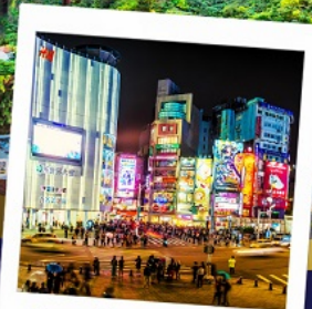
ช้อปปิ้งซีเหมินติง