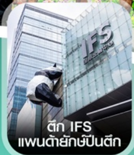
ตึก IFS แพนด้ายักษ์ป็นตึก