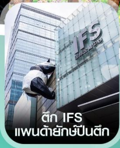
ตึก IFS แพนด้ายักษ์ป็นตึก