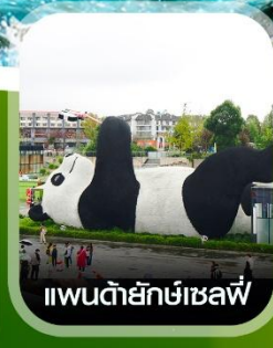
แพนด้ายักษ์เซลฟ์

✈️ คอนเฟิร์ม ออกเดินทาง ทุกพีเรียด 2 ท่านขึ้นไป