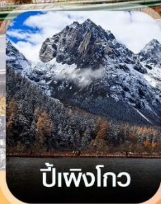
ปีเหมิงโกว

✈️ คอนเฟิร์มออกเดินทาง ทุกปีเรียด 2 ท่านขึ้นไป