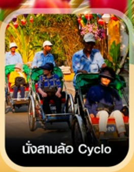
นั่งสามล้อ Cyclo