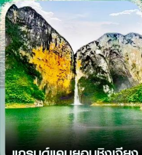
แกรนด์แคนยอนซิงเจียง