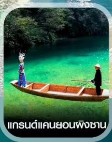
แกรนด์แคนยอนผิงชาน