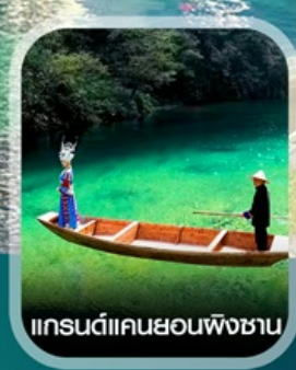
แกรนด์แคนยอนผิงซาน

✈️ คอนเฟิร์มออกเดินทาง ทุกพีเรียด 2 ท่านขึ้นไป