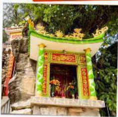
ศาลเจ้าติงซา