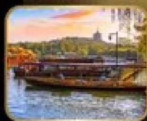
ล่องเรือ ทะเลสาบซีหู