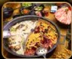
พิกเก็ต มินูทโทไฟฟ สุกี้ หม้อไฟสไตล์จีน