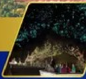
ตำหนอบเรื่องแกะ