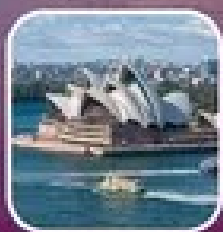
ชมวงเวียนโอเปร่าที่ ซิดนีย์