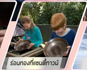
ร้อนทงที่แซนตีทาวน์