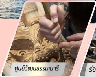
ศูนย์วัฒนธรรมเมารี