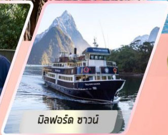
มิลฟอร์ด ซาวน์