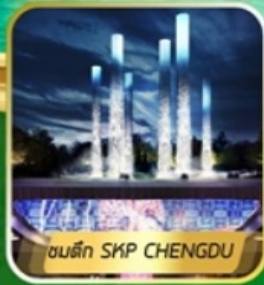
ชมตึก SKP CHENGDU