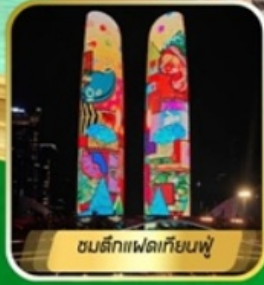
ชมตึกแฟลตเทียนฟู่