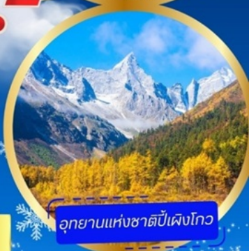
อุทยานแห่งชาติปี้เฟิงโกว