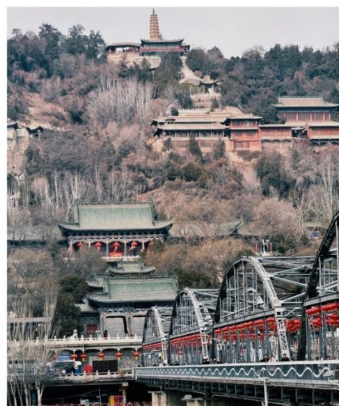
สะพานเหล็กแม่น้ำเหลืองจงซาน (Zhongshan Bridge)