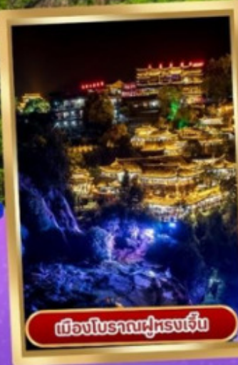
เมืองโบราณฝูหลงเจิ้น