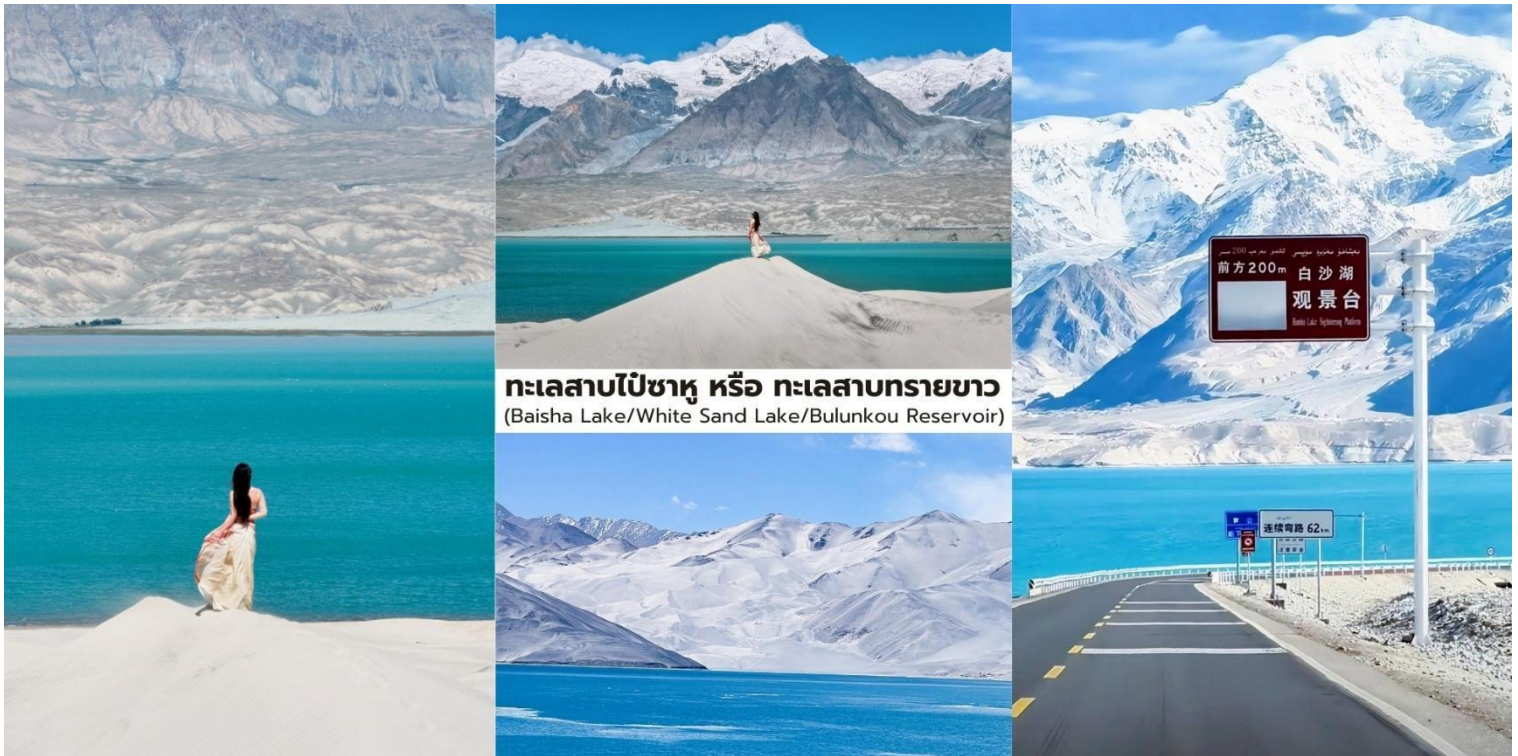
ทะเลสาบไปซาหู หรือ ทะเลสาบทรายขาว (Baisha Lake/White Sand Lake/Bulunkou Reservoir)

บ่าย นำท่านเที่ยวชม ทะเลสาบคาราคูล (Karakul Lake) ทะเลสาบธารน้ำแข็งขนาดใหญ่ ที่ตั้งอยู่บนความสูงประมาณ 3,600 กว่าเมตรเหนือระดับน้ำทะเล บริเวณเชิงเขา मुखากหืออาตาคำว่า "คาราคูล" ในภาษาเตอร์กหมายถึง "ทะเลสาบดำ" แต่ในวันที่อากาศแจ่มใสผืนน้ำของทะเลสาบจะปรากฏเป็น สีน้ำเงินคราม และทำหน้าที่เสมือน กระจกเงาธรรมชาติขนาดใหญ่ ที่สะท้อนภาพของภูเขาหิมะและท้องฟ้าออกมาสวยงามบริเวณรอบทะเลสาบเป็นถิ่นอาศัยของ ชนเผ่าคีร์กีซ ที่อาศัยอยู่ในบ้านแบบ ยูร์ต (Yurt) ซึ่งเป็นที่พักแบบดั้งเดิมของ ชนเผ่าเร่ร่อนในเอเชียกลาง นักท่องเที่ยวสามารถเดินชมทัศนียภาพรอบทะเลสาบและสัมผัสบรรยากาศธรรมชาติของที่ราบสูงปามีร์ที่เจียบสงบถือเป็นหนึ่งในจุดชมวิวกุเขาหิมะและทะเลสาบที่สวยงามที่สุดของเส้นทางสายปามีร์