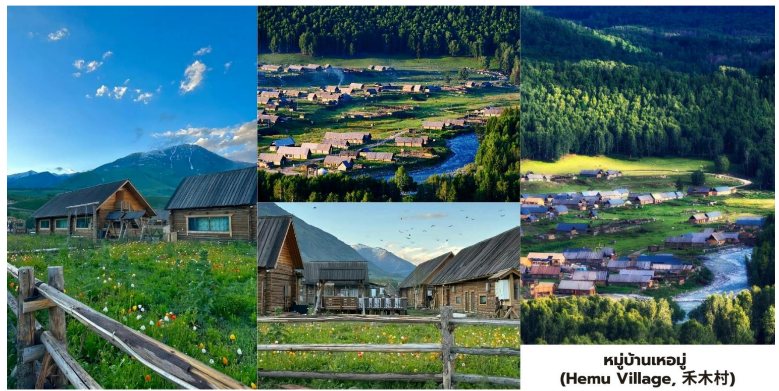
หมู่บ้านเหมอู่ (Hemu Village, 禾木村)

นำท่านเดินทางสู่ หมู่บ้านเหมอู่ (Hemu Village, 禾木村) คือหนึ่งในภาพจำของซินเจียงเหนือเป็นสถานที่ที่ได้รับการยกย่องจากช่างภาพทั่วโลกว่าเป็น "หมู่บ้านที่สวยงามที่สุดในประเทศจีน" และเป็นหนึ่งในไม่กี่แห่งที่คุณจะยังได้สัมผัสวิถีชีวิตดั้งเดิมของชนเผ่า ทูหว่า (Tuwa) เหมอู่ตั้งอยู่กลางหุบเขาและถูกล้อมรอบด้วยป่าสนที่หนาแน่น บ้านเรือนในหมู่บ้านสร้างขึ้นด้วย ซุงไม้สน (Log Cabin) ในรูปแบบดั้งเดิม ทำให้ยังคงรักษากลิ่นอายของชุมชน เลี้ยงสัตว์บนที่ราบสูงไว้ได้อย่างสมบูรณ์ เหมอู่คือประสบการณ์ที่คุณจะได้ตื่นขึ้นมาพร้อมกับแสงแรกของวันและ ทะเลหมอกทราวดับหลุดเข้าไปในโลกแห่งเทพนิยาย