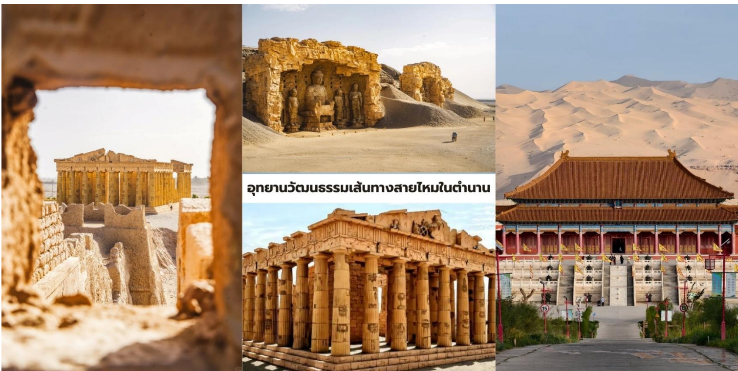
อุทยานวัฒนธรรมเส้นทางสายไหมในตำนาน

อารยธรรมโลกจำลอง: การจำลองสถาปัตยกรรมต่างประเทศ เช่น วิหารกรีก (Greek Temple) และ เจดีย์สี่หน้า (สี่เศียร) ที่ให้ความรู้สึกเหมือนเดินอยู่ต่างทวีป