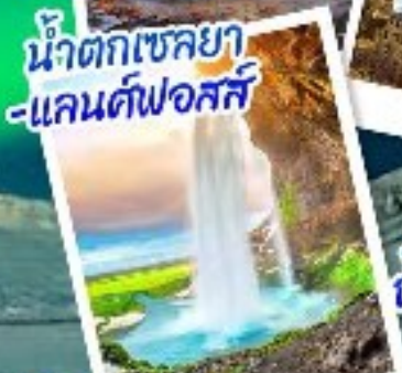
น้ำตกเซลยาแลนค์ฟอสส์