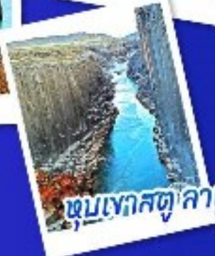
หุบเขาสตูลาเกล