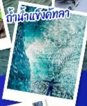
ถ้ำน้ำแข็งคัทลา