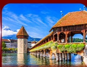
สะพานไม้อาเปลา ลูซิรีน