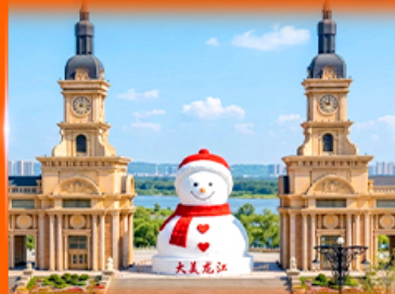
ตึกตาสหิมะยักษ์ ฮาร์บิน