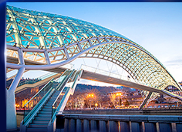
สะพานแห่งสันติภาพ ทบิลีซี