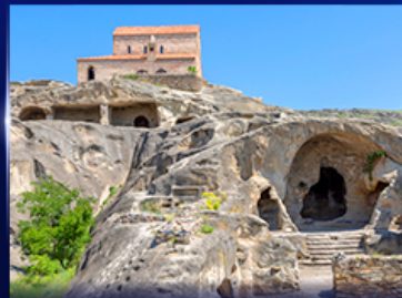
เมืองถ้ำโบราณ อุพลิสซิค