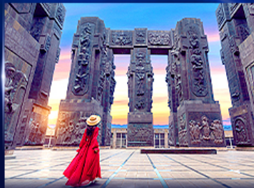
อุทยานประวัติศาสตร์จอร์เจีย