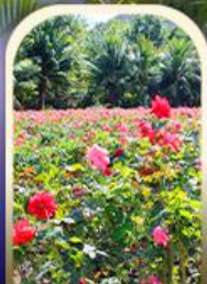
ทุ่งอ่าวย่าหลง