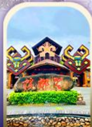
หมู่บ้านชนเผ่า