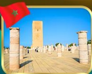
หอคอยฮัลซัน ราบัต