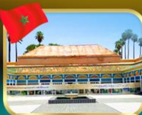
พระราชวังบาเฮีย