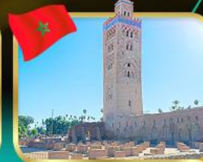
มัสยิดคูตูเบีย มาราเกช