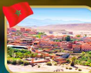
เมืองไอก์ เบนฮัดดู