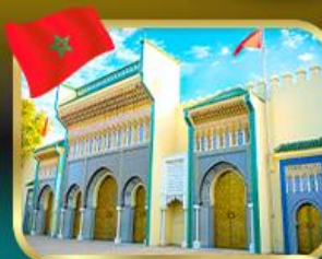
ประตูพระราชวังหลวง