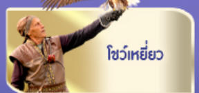
โชว์เหยี่ยว