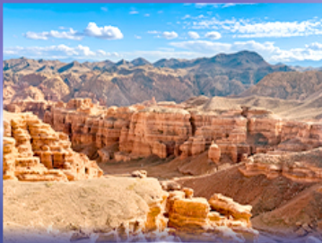
หุบเขาชาริน แคนยอน