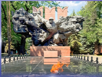
สวนสาธารณะ 28 Panfilov Park