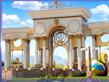
สวนสาธารณะประธานาธิบดี