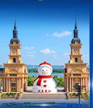
ตุ๊กตาหิมะยักษ์ ฮาร์ฮิน