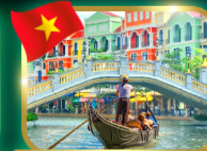
เวนิสจำลอง แกรนด์ เวลด์