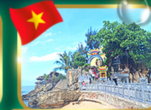
สักการะขอพรศาลเจ้าดิวงศา