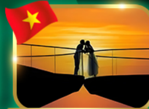
ชมอาทิตย์ตก ณ สะพานจู