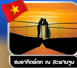
ชมอาทิตย์ตก ณ สะพานงู