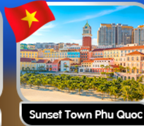
Sunset Town Phu Quoc