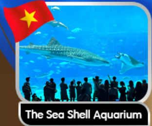
The Sea Shell Aquarium