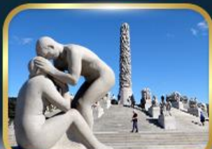
สวนอุทยานฟรอกเนอร์