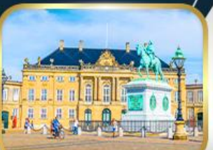
พระราชวังอมาเลียนบอร์ก

ล่องเรือสำราญ DFDS • ลิตเติ้ลเมอร์เมด • พระราชวังคริสเตียนบอร์ก • มหาวิทยาลัยออสโล • อนุสาวรีย์คาร์ลสตัด • ถนนคนเดินดรอทนิงกาดัน • ย่านบูฮาวัน • ถนนสตโรยัก