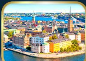
เที่ยวเมืองสต็อกโฮล์ม