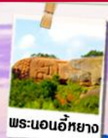
พระนอนอียาง