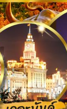
เดอะมันด์