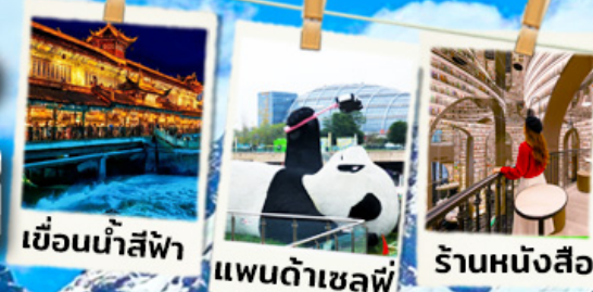
เขื่อนน้ำสีฟ้า

เที่ยวจีน 6 วัน 5 คืน 2 เมืองดัง ทัวร์ธงจีน เฉิงตู เขาเสียดรุณี