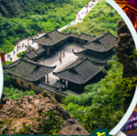
อุทยานหลุมฟ้า สะพานสวรรค์