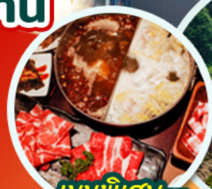
เมนูพิเศษ ชาบูหม่าล่า