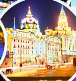
เดอะมันด์