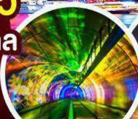
อุโมงค์เลเซอร์