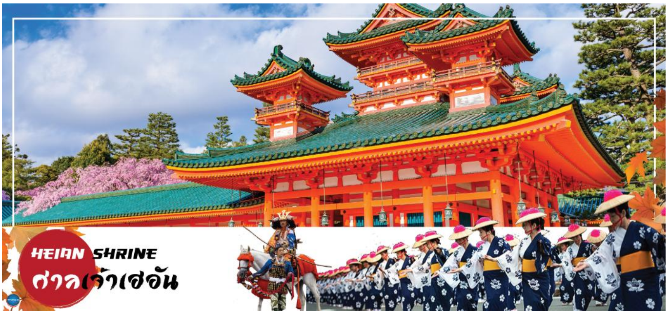
HEIAN SHRINE ศาลเจ้าเฮอัน

วันที่ห้า เมืองนาโกย่า – เมืองเกียวโต – ศาลเจ้าเฮอัน – การเรียนพิธีชงชาญี่ปุ่น – เมืองโอซาก้า – ศาลเจ้านัมมะยาซากะ – ช้อปปิ้งชินไซบาชิ