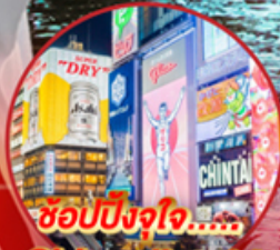
ช้อปปิ้งใจ..... Shinsabashi

โอโห้!! ชมใบไม้เปลี่ยนสีที่สวยงามที่สุดในภูมิภาค ณ หมู่เขาโคริงเค อสังการไฟลันดวณ ณ หมู่บ้านนาบะโนะ โนะ ซาโตะ ชม หมู่บ้านมรดกโลกการ์นต์โดย UNESCO ณ หมู่บ้านชิราคาว่าโตะ ปราสาทมัตสึโมโตะ เป็น 1 ใน 12 ปราสาทดั้งเดิมที่ยังคงสมบูรณ์และสวยงาม ชมสวนสไตล์ญี่ปุ่น และเยือน วัดกินคะคุจิ หรือ วัดเงิน แห่งเมืองเกียวโต